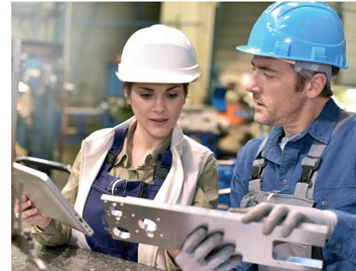
Teilqualifikation 2: Bauteile zu Baugruppen fügen