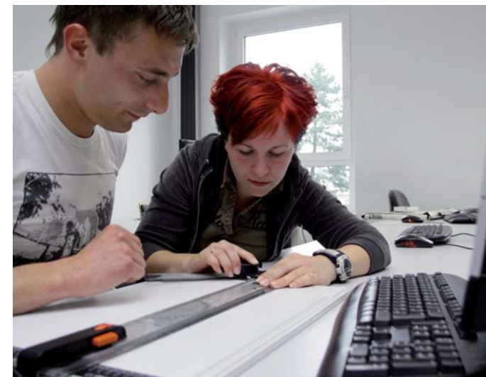
Einzelmaßnahme gem. § 45 SGB III

Im Vorfeld einer beruflichen Qualifizierung